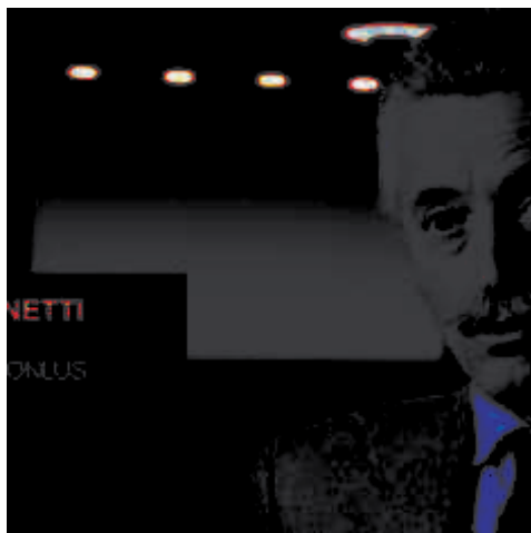
Onlus “Marco S. – No alla Sla” disponibili per